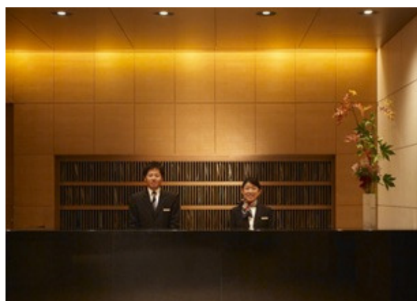
【愛宕グリーンヒルズ プラザ】