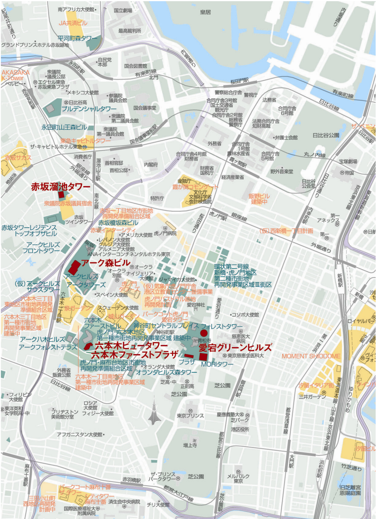
参考資料4 物件案内図（周辺ポートフォリオマップ）